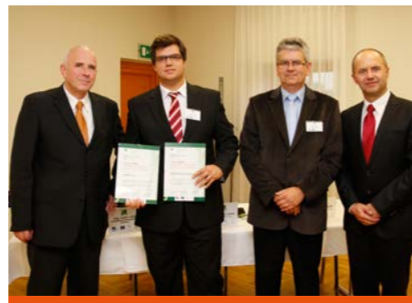
Ocenění si z rukou představitelů SP ČR, HK ČR a společnosti TREXIMA převzalo 25 společností.

Jak využíváte NSK ve své společnosti? Jsme se ptali zástupců oceňovaných firem.